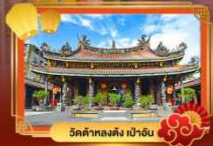
วัดต้าหลงตง เป่าอั้น