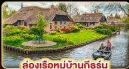
ล่องเรือหมู่บ้านกังหัน