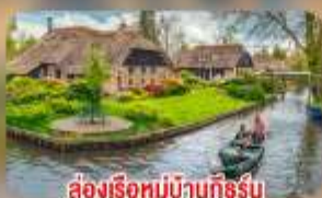
สองเรือหมู่บ้านทึร์น