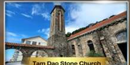
Tam Dao Stone Church