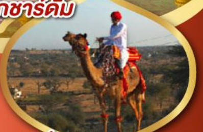
ฟรี ขี่อูฐ เมืองมันทาวา ราคาเริ่มต้น