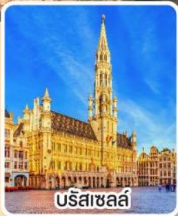
บรีสาชลล์