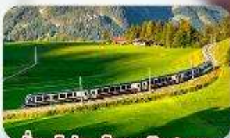
นั้รงรถไฟสายโรแมนติก 2 สาย Golden Pass / Luzern Interlaken Express