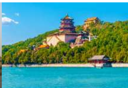
พระราชวังฤดูร้อนหยี่เหอหยวน