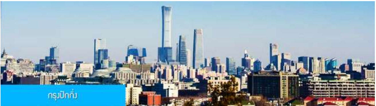
กรุงปักกิ่ง