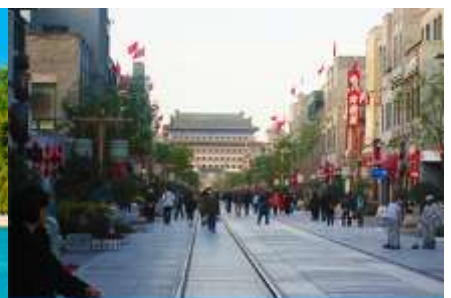
ถนนเวียนเหมิน