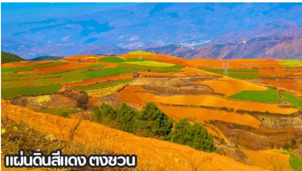
แผ่นดินสีแดง ตงชว่น

นำทุกท่านเดินทางสู่ เมืองตงชว่น (DONGCHUAN) หรือที่รู้จักกันในชื่อ หงถู่ตี้ ซึ่งแปลว่าแผ่นดินสีแดง เมืองตงชว่นตั้งอยู่ทางทิศตะวันออกเฉียงเหนือของมณฑลยูนหนาน มีภูมิประเทศเป็นทิวเขาสลับซับซ้อน ชาวพื้นเมืองส่วนใหญ่ประกอบอาชีพปลูกข้าวสาลี มันสำปะหลัง ผักต่างๆ และดอกไม้เน่านาพันธุ์ และตงชว่น ยังถือว่าเป็นจุดท่องเที่ยวไฮไลต์อีกหนึ่งแห่งของคุนหมิง เป็นจุดที่นักท่องเที่ยวนิยมแวะมาเก็บภาพบรรยากาศที่สวยงาม นำท่านชม ภูเขาเจ็ดสีแห่งตงชว่น หรือ แผ่นดินสีแดง (DONGCHUAN RED LAND) ตั้งอยู่ในเขตเมืองตงชว่น ทางตอนเหนือของคุนหมิง มีภูมิประเทศเป็นทิวเขาสลับซับซ้อนและนาขั้นบันไดที่กว้างสุดสายตา พื้นแผ่นดินที่เป็นเนื้อดินสีแดงเกิดจากการออกซิไดซ์ของธาตุเหล็ก และแร่ธาตุอื่นๆ ในเนื้อดิน พื้นที่บริเวณนี้จึงเกิดเป็น