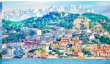
หมู่บ้านชาวประมงซาจื่อโข่ว