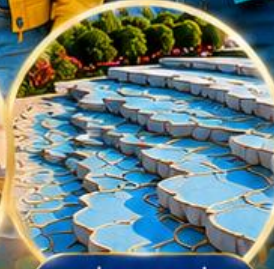
ปานุกคาล่ Pamukkale