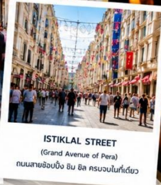
ISTIKLAL STREET (Grand Avenue of Pera) ถนนสายช้อปปิ้ง อิม บิล ครบจบในที่เดียว