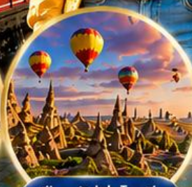
เมืองคัปปาโดเกีย Cappadocia