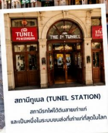
สถานีทูเนล (TUNEL STATION) สถานีรถไฟใต้ดินสายเก่าแก่ และเป็นหนึ่งในระบบขนส่งที่เก่าแก่ที่สุดในโลก