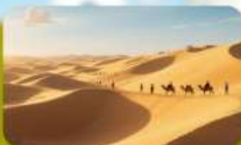
เนิกรายอินเคินทาลา