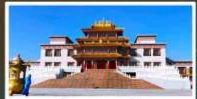
คฤหาสน์พุทธบูชาแห่งชีวิตยูลาน