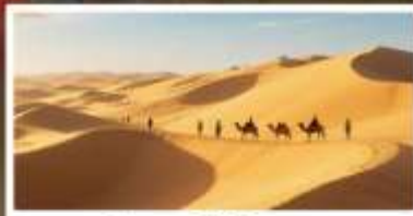
เป็นกรายอินเคินกาลา