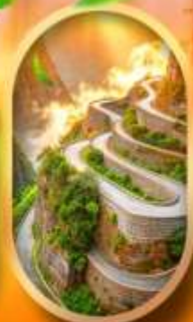
หุบเขาป้ายจ้าง