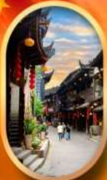
เมืองโบราณฟูหลงเจี้ยน