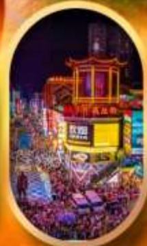
ถนนคนเดินซิงลู่