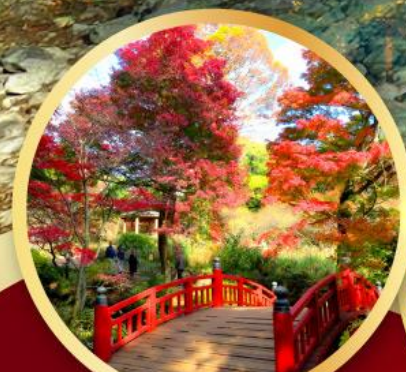
สวนดอกบ๊วยอาคางิ