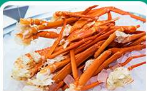
พิเศษ! บุฟเฟ่ต์ขาปู