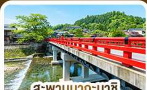
สะพานนากะบาชิ ทาดายาม่า