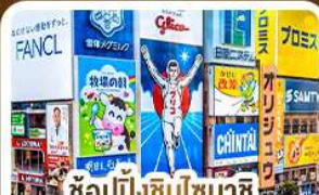
ช้อปปิ้งชินไซบาชิ และโดตงโมริ