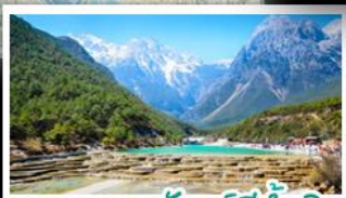
เขุบเขาพระจันทร์สีน้ำเงิน