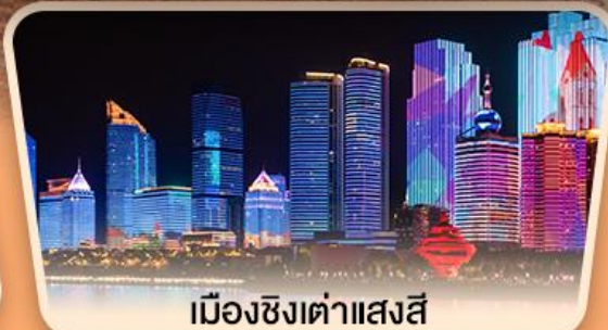
เมืองซิงต้าแสงสี