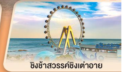
ชิงช้าสวรรค์ซิงต้าอายุ