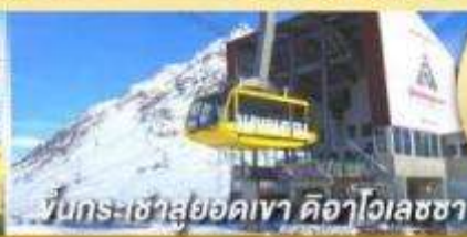
ขึ้นกระเช้าสู่ยอดเขา คีอาไวเลซซา