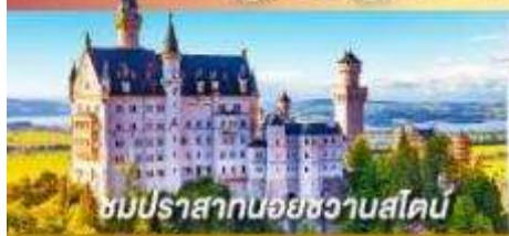
ชมปราสาทน้อยชวานสไตน์