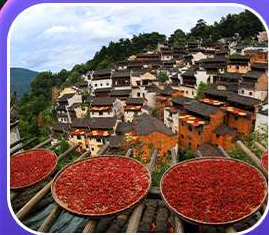
“หมู่บ้านหวงหลิง”

หุบเขาเทวดาวังเซียนกู่ หมู่บ้านที่ตั้งอยู่ริมหน้าผา • หมู่บ้านโบราณหวงหลิง ป่าสนน้ำชิงซาน • ล่องเรือทะเลสาบซีหู • ถนนโบราณตุ๋นโจว • ชมแสงสีที่ ฉู่หนีโจว