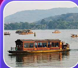
“ล่องเรือทะเลสาบซีหู”