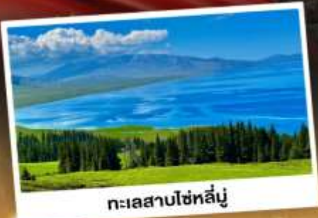
ทะเลสาบไซท์ลี่นู่

ชมวิวดอกคังการแบบยุโรปผสมเอเชีย กุ้งหนุ่ยเขียวดำ ทะเลสาบสีเทอร์ควอยซ์