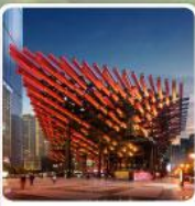
พิพิธภัณฑ์ศิลปะ-ตะเกียบ