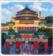
ศาลาประชาคมวงซิ่ง