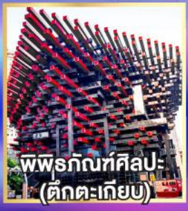
พิพิธภัณฑ์ศิลปะ: (ตึกตะเกียบ)