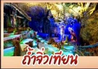
ถ้ำจิวเทียน