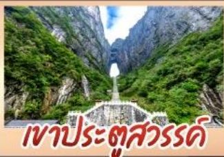
เขาประตูลำธาร