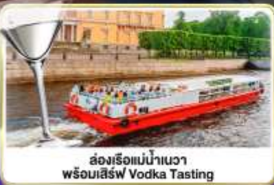
ล่องเรือแม่น้ำแคว พร้อมเสิร์ฟ Vodka Tasting