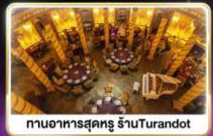
กานอาหารสุดหรู ร้านTurandot