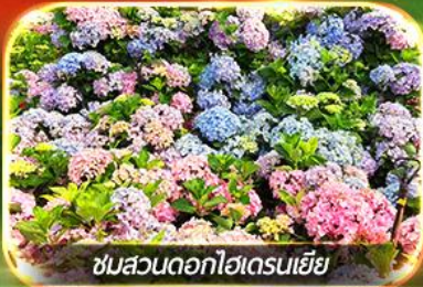
ชมสวนดอกไฮเดรนเจีย