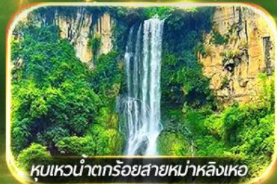
หุบเขาน้ำตกร้อยสายหม่าหลิงเหอ

ชมป่าภูเขาหมื่นยอด, เกี้ยวหมูบ้านโบราณหลินปู้อี ล่องเรือทะเลสาบว่างเฟิงหู, ชมสวนดอกไม้ตามฤดูกาล