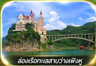
ล่องเรือทะเลสาบว่างเฟิงหู