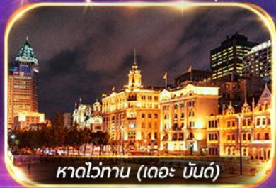
หาดว่อกาน (เดอะ บันด์)

เที่ยวดิสนีย์แลนด์เต็มวัน (รวมรถรับ-ส่ง) ช้อปปิ้งสุดฮิตที่ถนนนานกิง, FLORENTIA VILLAGE OUTLET, POP MART