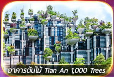
อาคารต้นไม้ Tian An 1,000 Trees

เดินทาง : มิถุนายน - ตุลาคม 2569 4 วัน | 2 คืน 春秋航空 น้ำหนักกระเป๋า 20 kg