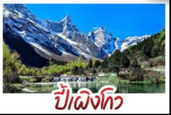
ปี่ฝิงโกว