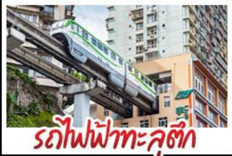
รถไฟไฟทะเลลู่ติก