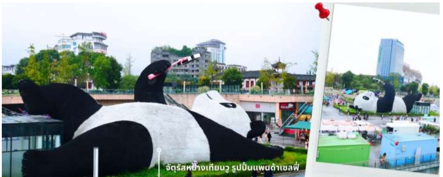
จัตุรัสหยางเทียนหวู่ รูปปั้นแพนด้าเซลฟ์

นำท่านเดินทางไปยัง จัตุรัสหยางเทียนหวู่ เป็นจุดเช็คอินที่สำคัญสำหรับคนที่มาเที่ยวที่ เมืองดูเจียงเยียน บริเวณจุดท่าข้าม อำเภอดูเจียงเยียน นครเฉิงตู ไฮไลท์ของจัตุรัสหยางเทียนหวู่ คือ ประติมากรรม แพนด้ายักษ์ที่กำลังนอนหงายท้องยื่นมือถือไม้เซลฟี่สีชมพู ซึ่งออกแบบโดยนักออกแบบชื่อดัง Florentijn Hofman รูปปั้นแพนด้า ยักษ์มีความยาว 26 เมตร กว้าง 11 เมตร สูง 12 เมตร และหนัก 130 ตัน แบบท่าทางสบายๆของแพนด้าที่ความประทับใจและรอยยิ้มให้กับผู้ที่มาเยือนจัตุรัสหยางเทียนหวู่ สามารถดึงดูดนักท่องเที่ยวได้เป็นจำนวนมากเลยทีเดียว เป็นการแสดงออกด้วยภาษาทางศิลปะแบบหนึ่งที่สะท้อนชีวิตในท้องถิ่น มอบความรู้สึกสนิทสนมและมีความสุขกับผู้ชม อิสระเดินชม