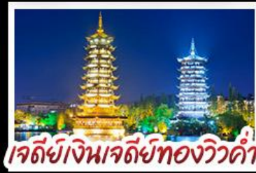
เจดีย์เงินเจดีย์ทองวิวคำ

หมู่บ้านแม้วซีเจียง - เขาหุ่ย - กุหลาบพันปี เมืองปี้เจียง เขาวงซ้าง - เจดีย์เงินเจดีย์ทองวิวคำ - เขาหุ่ย ซ้อปึงกับถนนคนเดิน ซีเซียง - ซีเจียง เมนูพิเศษ บุฟเฟ่ต์ชาบูซีฟู้ด ปลาอบเบียร์ ฝ่อกคริสตล สุกี้เห็ด