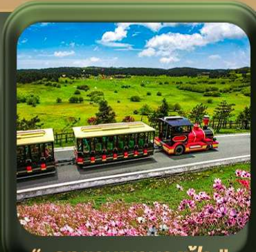
" อุทยานเขานางฟ้า "

T2G-CKG26CZ Special of Chongqing... วงซิ่ง ต้าจู้ อุ้หลง อุทยานหลุมฟ้า เขานางฟ้า 5D 3N (CZ)