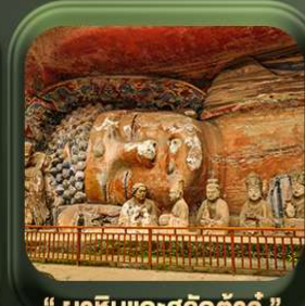
" พาหินแเกาะสลักต้าจู้ "