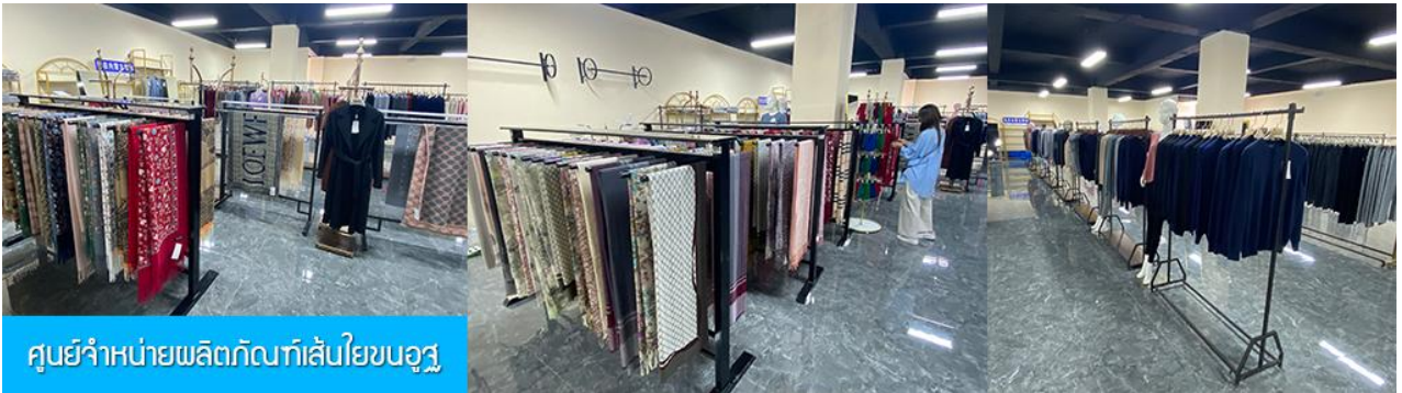
ศูนย์จำหน่ายผลิตภัณฑ์เส้นใยขนอูฐ

พักที่ ORDOS GLASSLAND MONGOLIAN YURT เป็นห้องพักสไตล์มองโกเลีย (กระโจม)