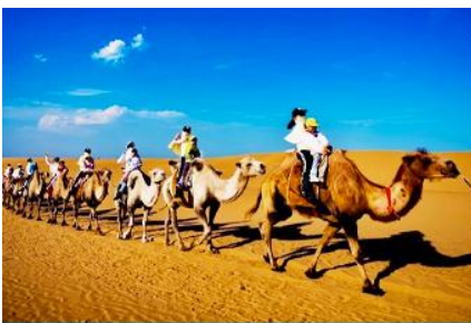
เบ็นทรายเสี่ยงชวาน

เที่ยง รับประทานอาหารกลางวัน ณ ภัตตาคาร (11)