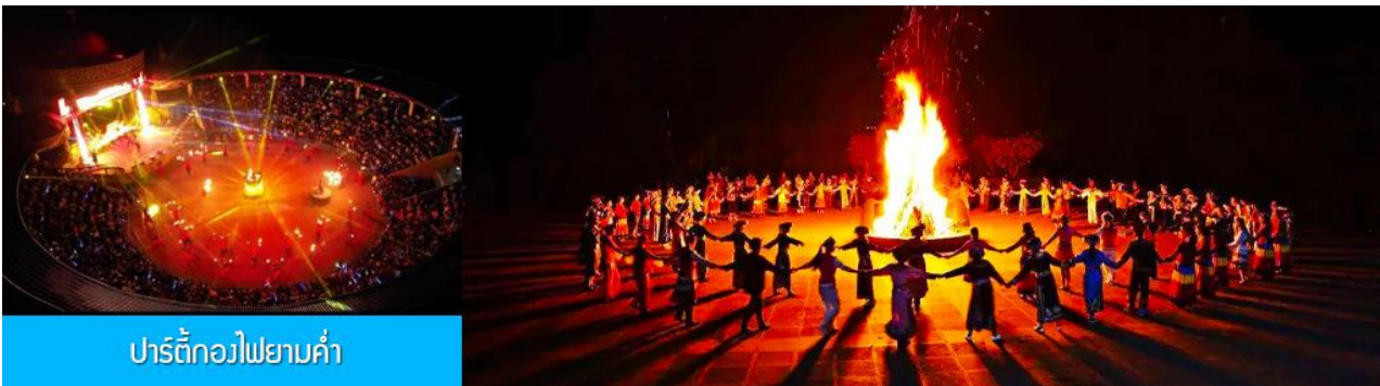
ปาร์ตี้กองไฟยามค่ำ