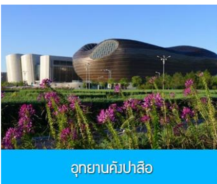
อุทยานคังปาสือ