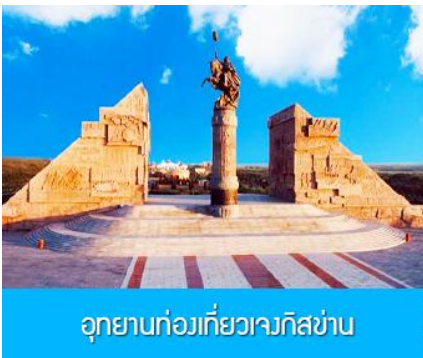
อุทยานก๋อเวี่ยวเจงกิสข่าน