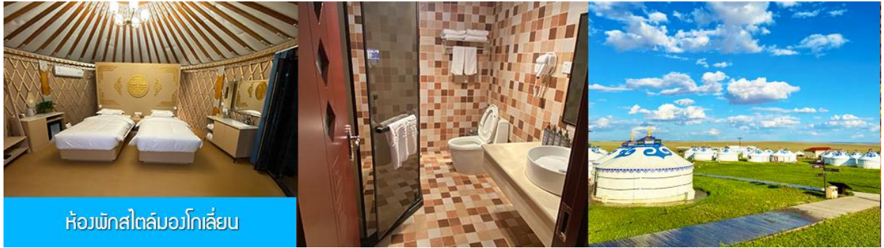
ห้องพักสไตล์มองโกเลีย

พักที่ ORDOS GLASSLAND MONGOLIAN YURT เป็นห้องพักสไตล์มองโกเลีย (กระโจม)