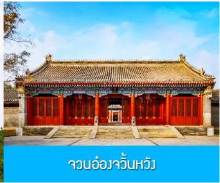
จวนอ๋องจวินหวัง

วันที่หก เมืองเออร์ดอส -อี้ค้อเอ้าเป่า-พิพิธภัณฑ์เครื่องเงิน-จวนอ๋องจวินหวัง- สวนวัฒนธรรมหมงกู่หยวน หลิว-ซื้อปิ้งถนคนเดิน