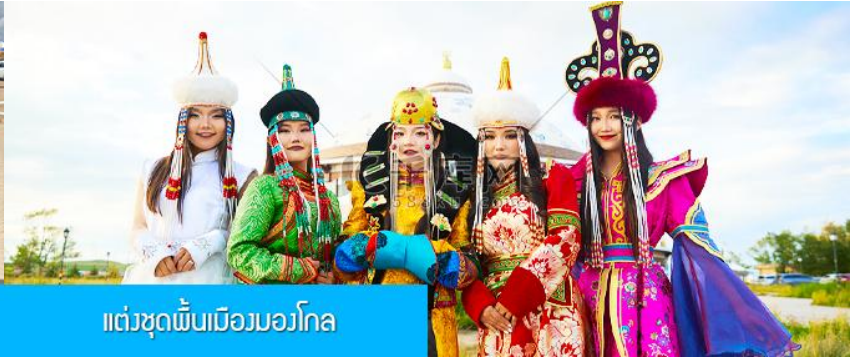
แต่งชุดพื้นเมืองมองโกล