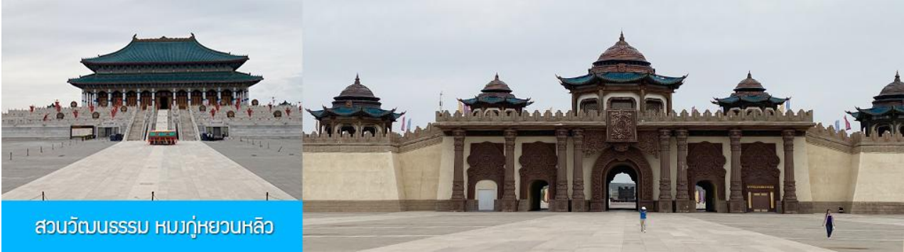
สวนวัฒนธรรม หมงกู่หยวนหลิว

หลังอาหารนำท่าน เที่ยวชม จวนอ๋องจวินหวัง 郡王府 จวนแห่งนี้เริ่มสร้างขึ้นในปี ค.ศ. 1902 สร้างเสร็จในปี ค.ศ. 1936 เป็นที่พำนักของ อ๋องอีฉีจวินหวัง 伊旗郡王 เป็นจวนอ๋องเพียงหนึ่งเดียวได้รับการอนุรักษ์ในสภาพที่สมบูรณ์ โครงสร้างทำด้วยอิฐ หิน และไม้ ประกอบด้วยห้องพัก 16 ห้อง เป็นสถาปัตยกรรมผสมแบบมองโกล ทิเบต และฮั่น