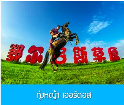
ทุ่งหญ้า เออร์ดอส

พักที่ ORDOS BOYU AIRUI HOTEL โรงแรมระดับ 4 ดาวท้องถิ่น หรือเทียบเท่าในเมืองเออร์ดอส