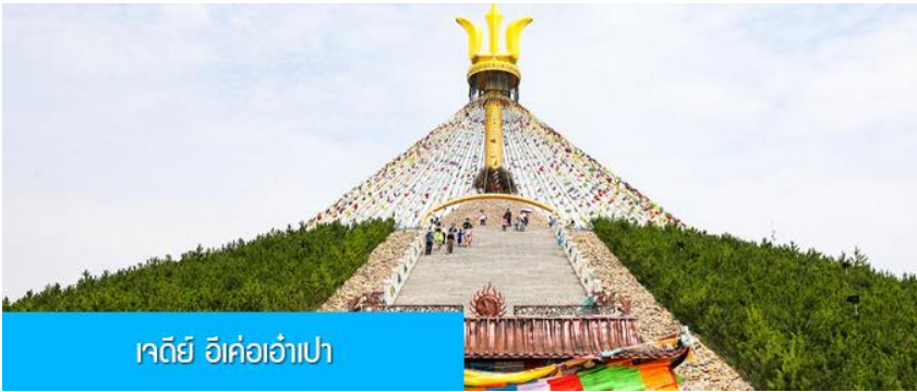
เจดีย์ อี้ค้อเอ้าเป่า

พักที่ DALAEQI SHNAGJING HOTEL โรงแรมระดับ 4 ดาวหรือเทียบเท่าในเมืองต้าลาเท่อ