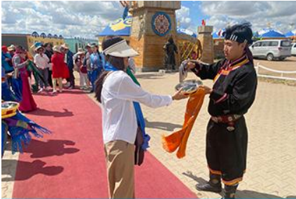
พิธีต้อนรับแขกด้วยเหล้า

รับประทานอาหารกลางวัน ณ ร้านอาหารพื้นเมืองในเขตอุทยาน (8)