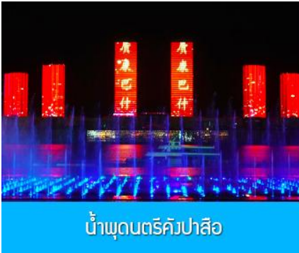
น้ำพุดนตรีคังปาสื่อ