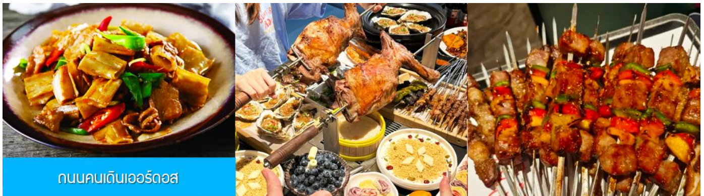
ถนนคนเดินเออร์ดอส

นำท่านเที่ยวชม สวนวัฒนธรรมหมงกู่หยวนหลิว 蒙古源流 เป็นอุทยานท่องเที่ยวเชิงประวัติศาสตร์และวัฒนธรรมระดับ 4A ของจีน ที่เป็นต้นกำเนิดของชนชาติและวัฒนธรรมมองโกล สะท้อนความเป็นจักรวรรดิที่ยิ่งใหญ่เมื่อ 700 ปีก่อน ชม ประตูจงเทียน 崇天门 สุนคโพนารที่แสดงถึงความยิ่งใหญ่ของจักรวรรดิมองโกล ชม จัตุรัสเถิงเก่อหลี่ 腾格里广场 จัตุรัสกลางแจ้งขนาดใหญ่ที่ใช้ประกอบพิธีกรรมต่าง ๆ