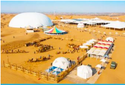
เกาะกลางทะเลทรายเซียนซาเต๋า