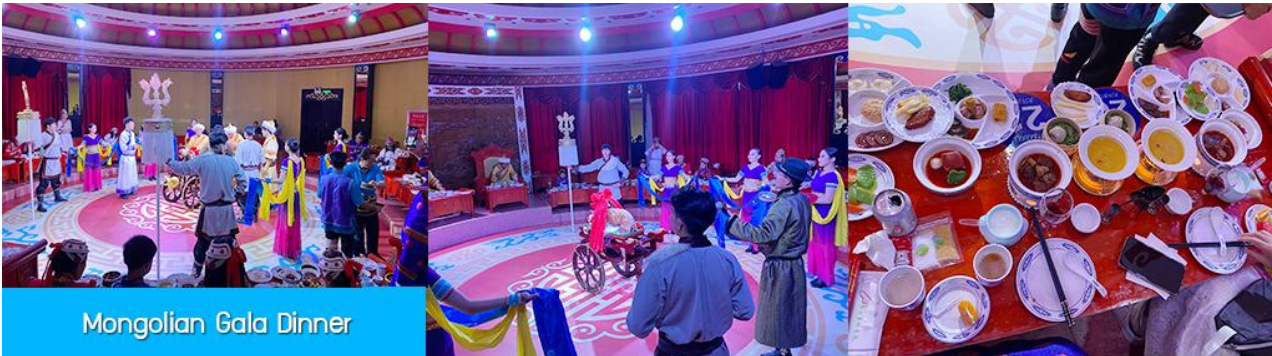
Mongolian Gala Dinner

ให้เลือกเล่นได้ 12 อย่างตามรายการที่ระบุ.....อัตราค่าบริการสำหรับ 那达慕 Naadam Festival 380 หยวน หรือ 1,900 บาท/ท่าน (สำหรับลูกค้าทัวร์ที่ไม่ซื้อโปรแกรมเสริม สามารถเดินเล่น ถ่ายรูปบริเวณทุ่งหญ้าหรือพักผ่อนตามอัธยาศัย)