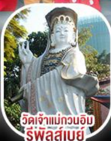
วัดเจ้าแม่กวนอิมรีพัลส์เบย์