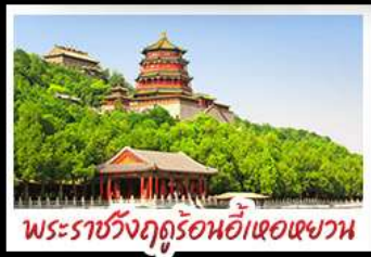
พระราชวังฤดูร้อนอ้าหอยหวง

ท่าแพงเมืองจินด่านจวียงกวน - พระราชวังฤดูร้อนอ้าหอยหวง สวนจิ้งอัน - วัดลามะ - โมเดลร้านช้อปปิ้ง - โรงแรม 4 ดาว มือพิเศษ เปิดปีกกึ่ง สุกมืองโท MICHELIN GUIDE ร้าน TAO TAO JU