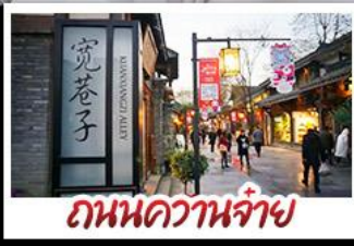
ถนนความจำ