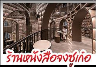
ร้านหนังสือจงซูเกอ

อุทยานภูเขาสี่ดรุณี อุทยานปี้เฉิงโกว หมู่แพนด้าอนแซลพี ร้านหนังสือจงซูเกอ วัดต้าฉือ ถนนโบราณความจำ ซ้อปิ้งย่านคิง ถนนไท่กู่หลี่ + ถนนซุนซู่ เมนูพิเศษ สุกี้หมาล่าเสวอน