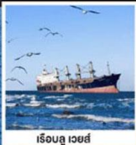
เรือลู เวย์ส์