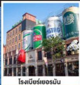
โรงเบียร์เยอรมัน