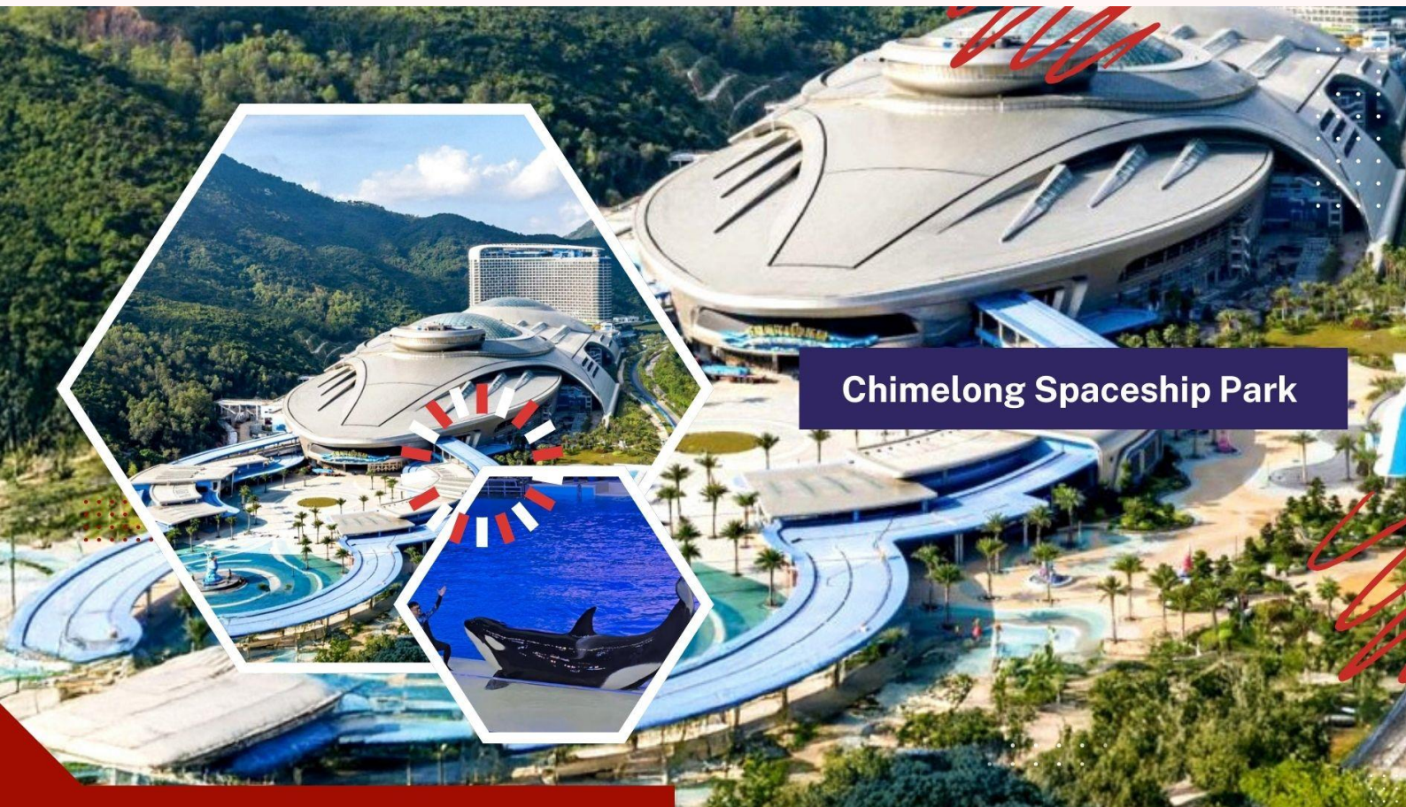
Chimelong Spaceship Park

** อิสระอาหารเที่ยง และอาหารค่ำ เพื่อไม่ให้เป็นการเสียเวลาในการท่องเที่ยว **