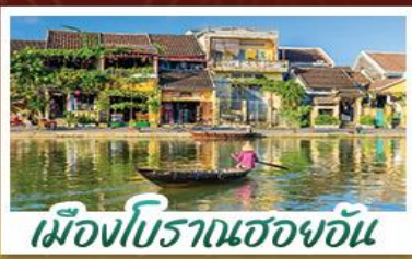
เมืองโบราณเฮอฮอัน

! พักบนเขานาฮิลล์ 1 คืน ! สัมผัสอากาศเย็นตลอดปี สตรีตฟรังเศสสุดคลาสสิก - นั่งกระเช้ายาวที่สุด สูบานาฮิลล์ สนุกสุดมันส์ไปกับสวนสนุก The Fantasy Park มีบริการเช่าแม่กวนอิมองค์ใหญ่ที่สุดของเมืองดานัง - เช็กอินเมืองมรดกโลกฮอยอัน - สนุกสนานไปกับกิจกรรม!!นั่งเรือกระดิง หมู่บ้านกัมถาน เช็กอินร้านกาแฟ SON TRA MARINA CAFE - ไม่ลงร้านช้อปปิ้ง - อิ่มอร่อยกับบุฟเฟ่ต์นานาชาติ , หม้อไฟซีฟู้ด