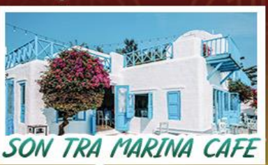
SON TRA MARINA CAFE