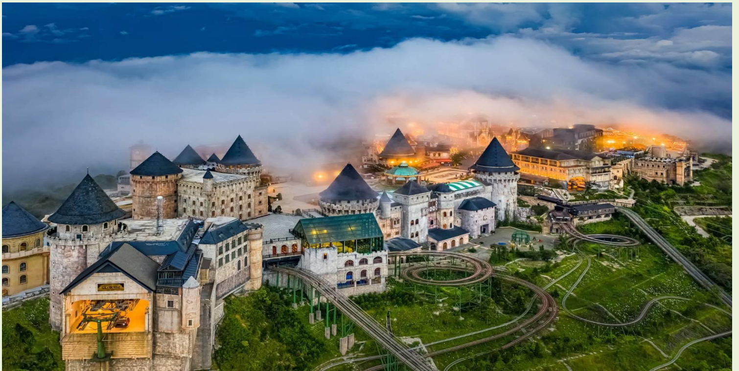
2UDAD-EK005 หลงเสน่ห์ เวียดนามกลาง ดานัง ฮอยอัน พักบานาฮิลล์ 1 คืน (ไม่ลงร้านช้อปปิ้ง) 3 วัน 2 คืน โดยสายการบิน Emirates Airlines (EK) Update 08 Apr 26