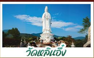
วัดเข็กินอึ้ง