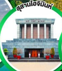
สุสานโฮจิมินห์