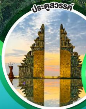
ประตูลสุวรรณศรี