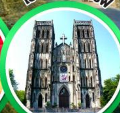
โบสถ์เซนต์โจเซฟ