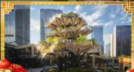
XIAN TREE&MIXC MALL