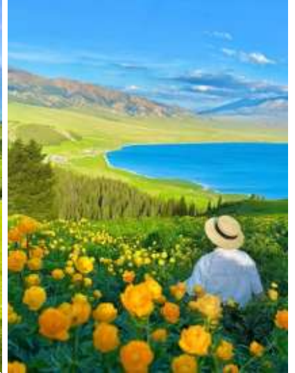
พาท่านนั่งกระเช้าชมทิวเขานาธาติจากมุมสูงและรถอุทยานนำเที่ยวรอบทุ่ง