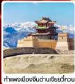
กำแพงเมืองจีนด่านเสี่ยววี่กวน

• ไซโล่...เส้นทางสายไหม ชมสระบัววังพระจันทร์ ทะเลทรายหมีงาช้าง กำแพงเมืองจีนด่านสุดท้าย "เจียยวี่กวน" มรดกโลกภูเขาสายรุ้งจางเย่