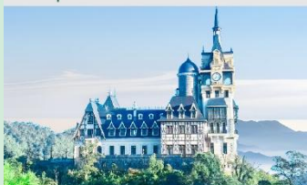
ปราสาทตามด้าว