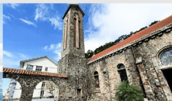
โบสถ์หินตามด้าว