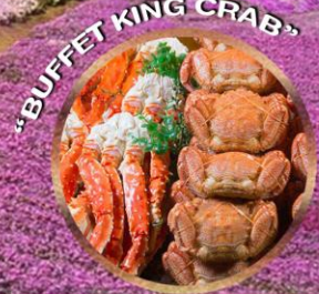
"BUFFET KING CRAB"