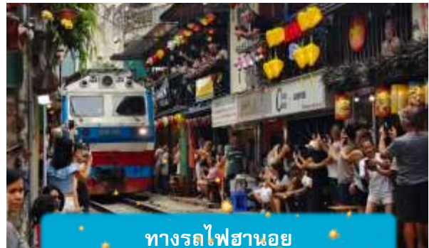
ทางรถไฟฮานอย