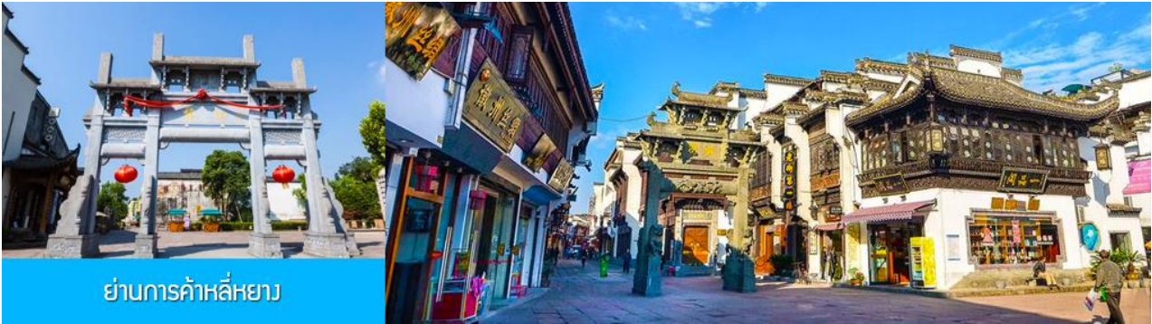
ย่านการค้าหลี่หยาง