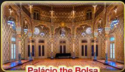
Palácio the Bolsa