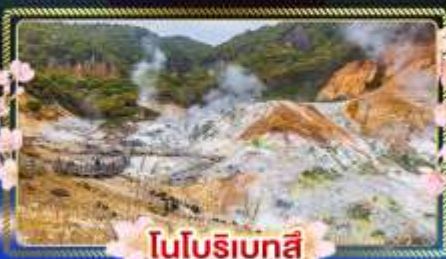
โนบุริเบทสึ

สัมผัสซากุระแสนโรแมนติก เที่ยวชมไฮไลท์ฮอกไกโดได้ ในช่วงที่สดชื่นที่สุดของปี