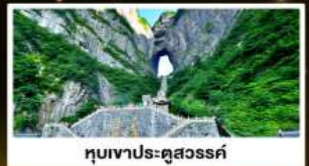
ทิวเขาประตูสวรรค์