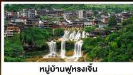
หมู่บ้านฟุทงเจิน