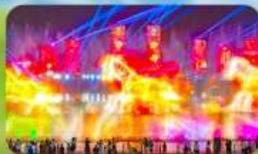
น้ำพุคนตรีคังปาสือ