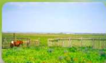
ทุ่งหญ้าออร์คอส