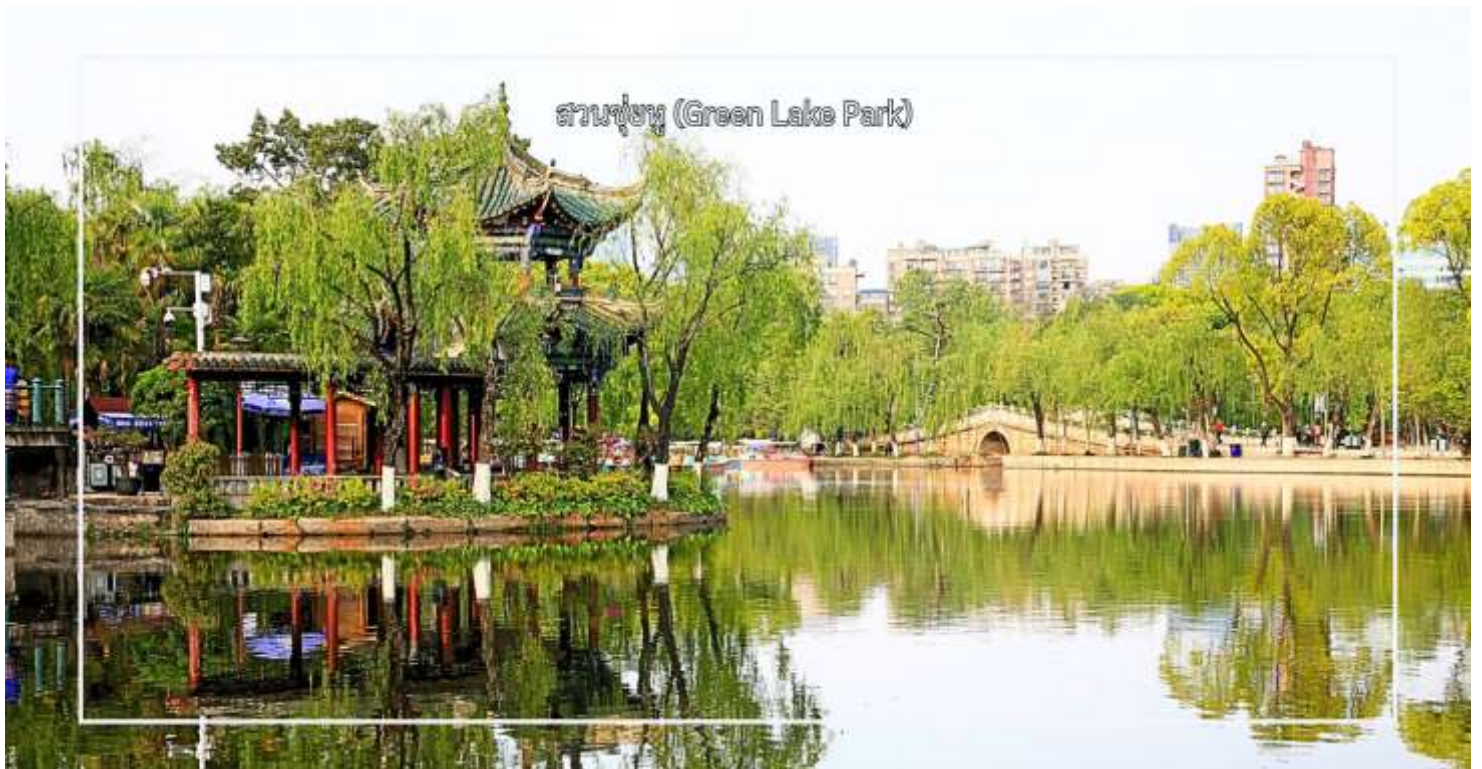
สวนชู่หู (Green Lake Park)

จากนั้นนำท่าน ชมทัศนียภาพ สวนชู่หู (Green Lake Park) เป็นสวนสาธารณะใจกลางเมืองคุนหมิงที่มีชื่อเสียงและได้รับความนิยมอย่างมาก โดดเด่นด้วยทะเลสาบสีเขียวมรกตที่โอบล้อมด้วยต้นไม้ร่มรื่น และบรรยากาศผ่อนคลาย เหมาะแก่การพักผ่อนและเดินเล่น สวนแห่งนี้เป็นศูนย์รวมวิถีชีวิตของชาวคุนหมิง นักท่องเที่ยวสามารถชมกิจกรรมท้องถิ่น สัมผัสบรรยากาศธรรมชาติ และถ่ายภาพความสวยงามของสวนในทุกฤดูกาล